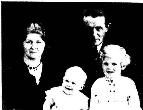
"T. P. B. og J. K. C. med de to ældste Børn"